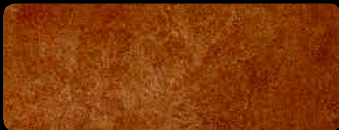
0150 Base Bronzo