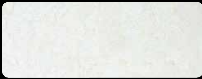
0070 Base Argento