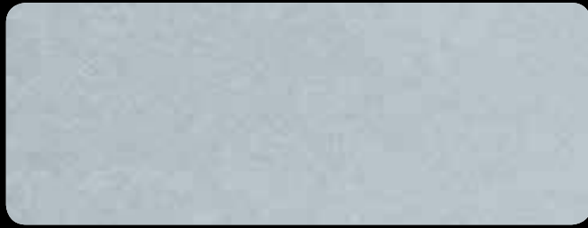
0170 Base Alluminio