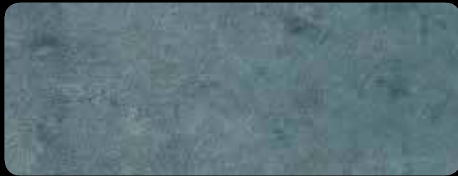
0180 Base Ardesia