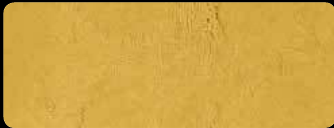
0190 Base Oro